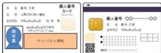
個人番号カードのイメージ例(表面、裏面)

カードのICチップに搭載された電子証明を用いて、e-Taxをはじめとする各種電子申請が行えます。